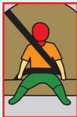
Без Устройства ФЭСТ