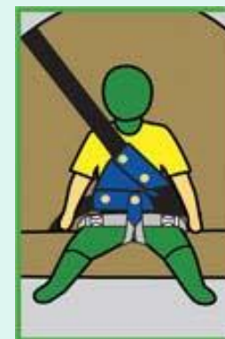
С Устройством ФЭСТ в комплекте с Лямкой ФЭСТ